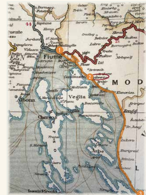
In der k. u. k.-Monarchie (1867–1918) entwickelte sich Crikvenica 2 an der ungarisch-kroatischen Küste zwischen Rijeka 1 und Karlobag 3 vom Fischerdorf zum noblen heilklimatischen Kurort.