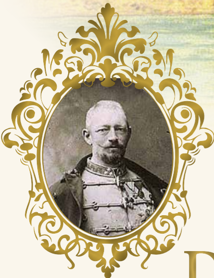
Erzherzog Josef Karl Ludwig von Österreich (1833–1905), Visionär und Erbauer des nach ihm benannten Palasthotels mit Gartenpark, Musikpavillon im Schweizer Stil und Strandbad (Foto oben, 1897).