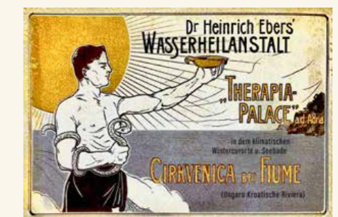
Von oben: Grand Hotel Erzherzog Josef (1896). Palace Hotel Therapia (1898) mit der neu errichteten Bootsanlegestelle »Crni molo«. Werbeplakat von Friedrich Ebers Wasserheilanstalt (1901).