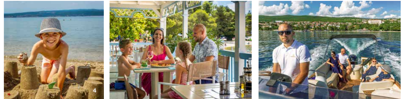
(1) In fünf Minuten von der (Sand)burg am Strand (4) durch den Park ins Schloss! (2) Plötzlich Prinzessin! – Königlich logieren und gleichzeitig tolle Ferien mit allem Drum und Dran machen: Eis essen, Baden, Bummeln, das Zauberwäldchen erobern (3) oder in der Palace-Beach-Bar einkehren (5). Sommerfrisch und für Kids ein Abenteuer: der Bootsausflug mit unserem Speed-Boot Giuseppe (6).

Ferienzeit ist Familienzeit! Zwei Sommermonate lang beflügelt das Kvarner Palace die Fantasie der Kinder, die sich im stilvollen Ambiente wie Prinz und Prinzessin fühlen und gleichzeitig in eine bunte Ferienvielfalt mit echten Abenteuern eintauchen dürfen. Sogar gratis, wenn sie zwei Erwachsene mitnehmen!